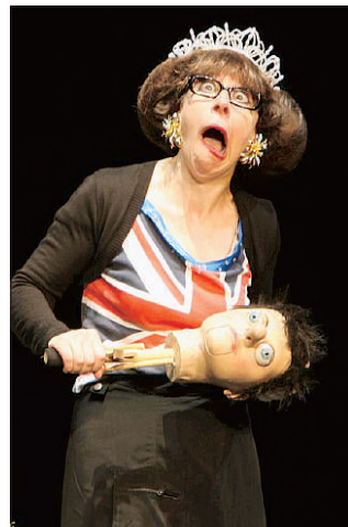
du mime, et n'a pas froid aux yeux. »

L'avis de l'équipe : « Une Anglaise nous a surpris, elle est issue du cirque et