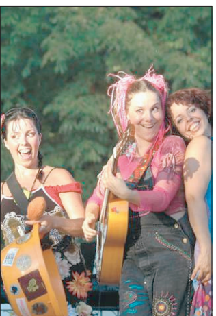
une ambiance maximum ! »

L'avis de l'équipe : « Nous leur avons donné une mission : amener le public à